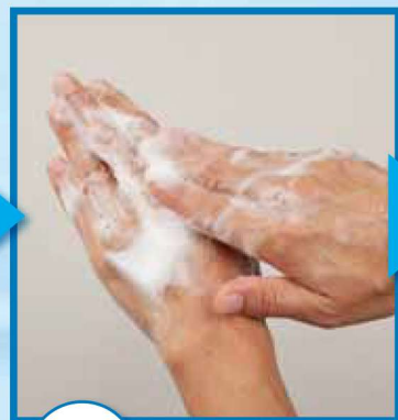
4 手の甲を伸ばすように洗う