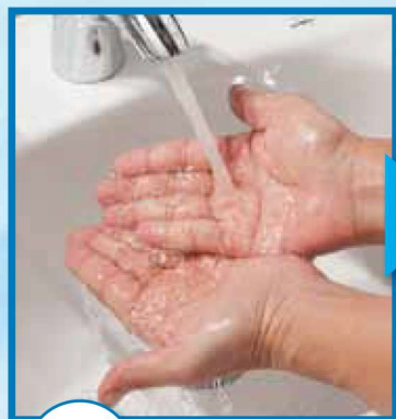
1 流水で手を濡らす