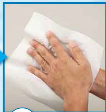
10 ペーパータオル等で水分を拭き取る