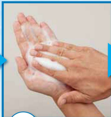
3 石けんを泡立て、手のひらをよく洗う