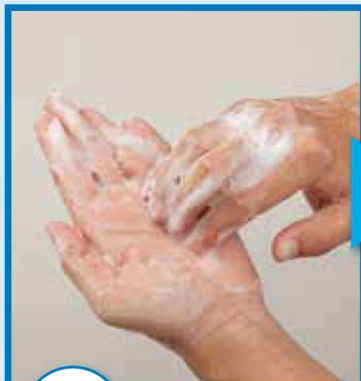
6 指先・爪の間を洗う