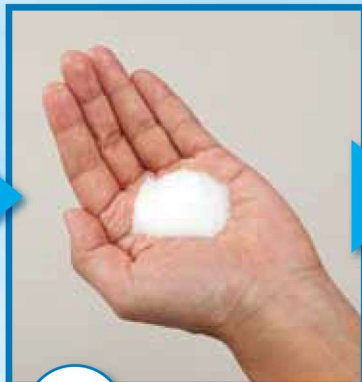
2 石けんを手のひらに適量取る