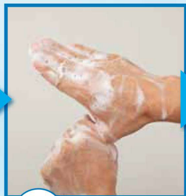
7 親指、付け根を洗う